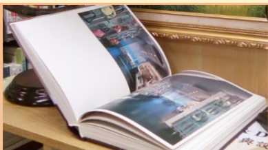
Course Reference 課程用書

「課程用書」是館藏內有關圖書作為相關課程的學習及教學用途。有些課程用書會放置在「研學館借閱處」，只在研學館館內閱覽。